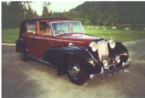
Humber Limousine 1947 Limousine 1948

Après la guerre, aux Snipe et pullman de 4,1 L., S'ajoute la Hawk avec un 4 cylindres de 2 L. d'origine Hillman.