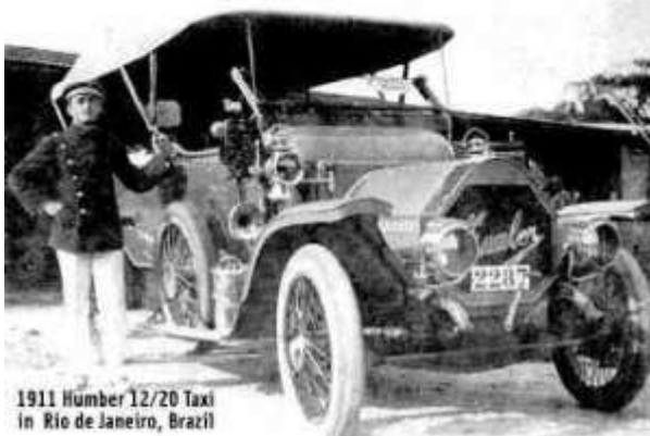
1911 Humber 12/20 Taxi in Rio de Janeiro, Brazil